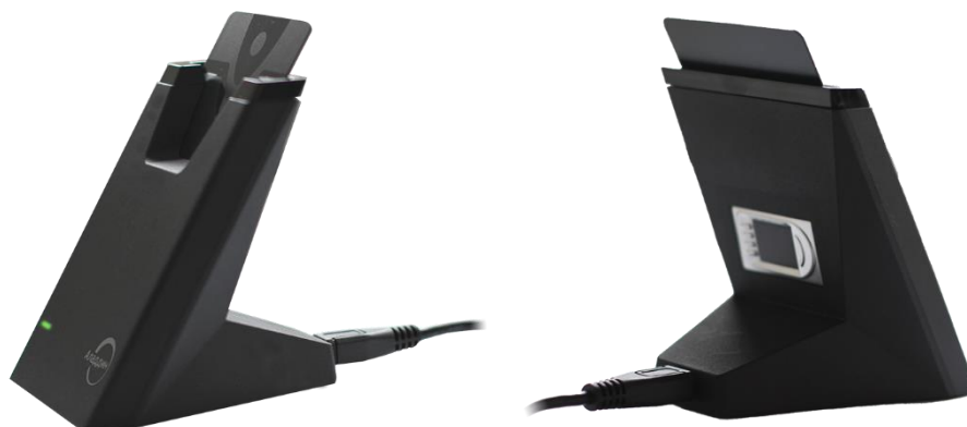
Рисунок 2 – Внешний вид смарт-карт ридера JCR781